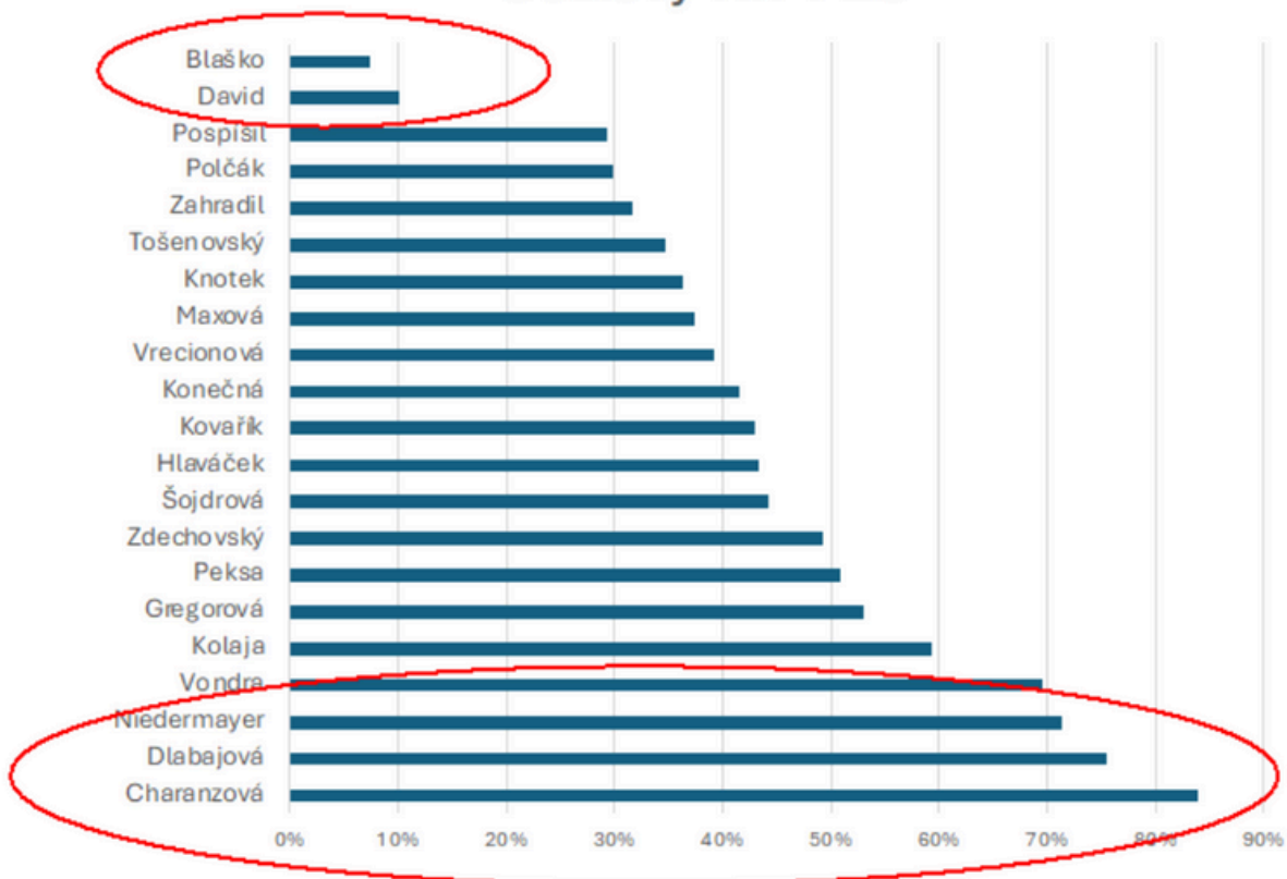
Celkový vliv v EU

Q: Jak velký vliv mají podle vašich zkušeností jednotliví/é čeští/ské eurposlanci/kyně uvnitř EU? (měřeno např. schopností prosazovat své priority do legislativy nebo utvářet názory své frakce)